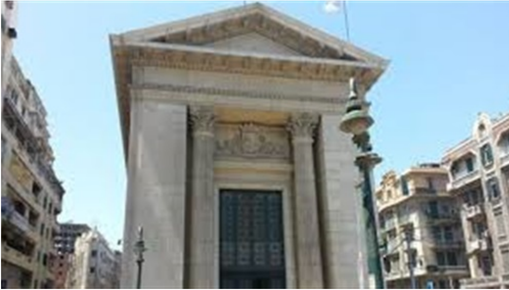
ر صانل ادبع لام ةي رذنكس إا اب ةي راجتلا ة فرغلا

التجارية بالإسكندرية، يومي السبت والأحد المقبلين، الدورة التدريبية الثانية لتصدير المنتجات ةفرغلا مظنت دي موروي عورشم راطي يف يبوروأا داحتال نم قلو ممل او يبوروأا الغذائية والزراعية إلى الاتحاد لود تارداص ةي منتو تارامثتسالا بذجل فدهي يذل او EU EuroMed Invest يم يلق إا تسفن إا قسطس وتملا او قري غصلا تاك رشلل ةي نفلل قنوعملا م يدقت بناج ي لإ ضي بآا رحبلا بونج ةي رصملا فرغلا داحتا جم ان رب راطي يف كل ذو ، تاداحتال او فرغلا تاردقو ةءافك عفرو . تاعاطقلا ةفاك يف تارداصلا ةي منتل ةعانصل او قراجتلا قرازو عم نواعتلاب